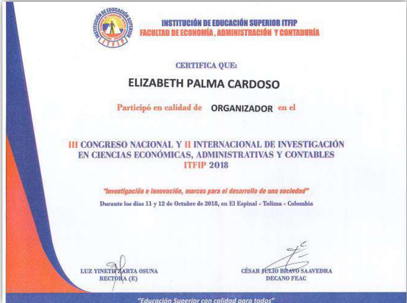
Imagen: Certificado Organizador