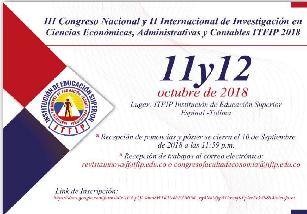
Imagen: Banner Publicitario