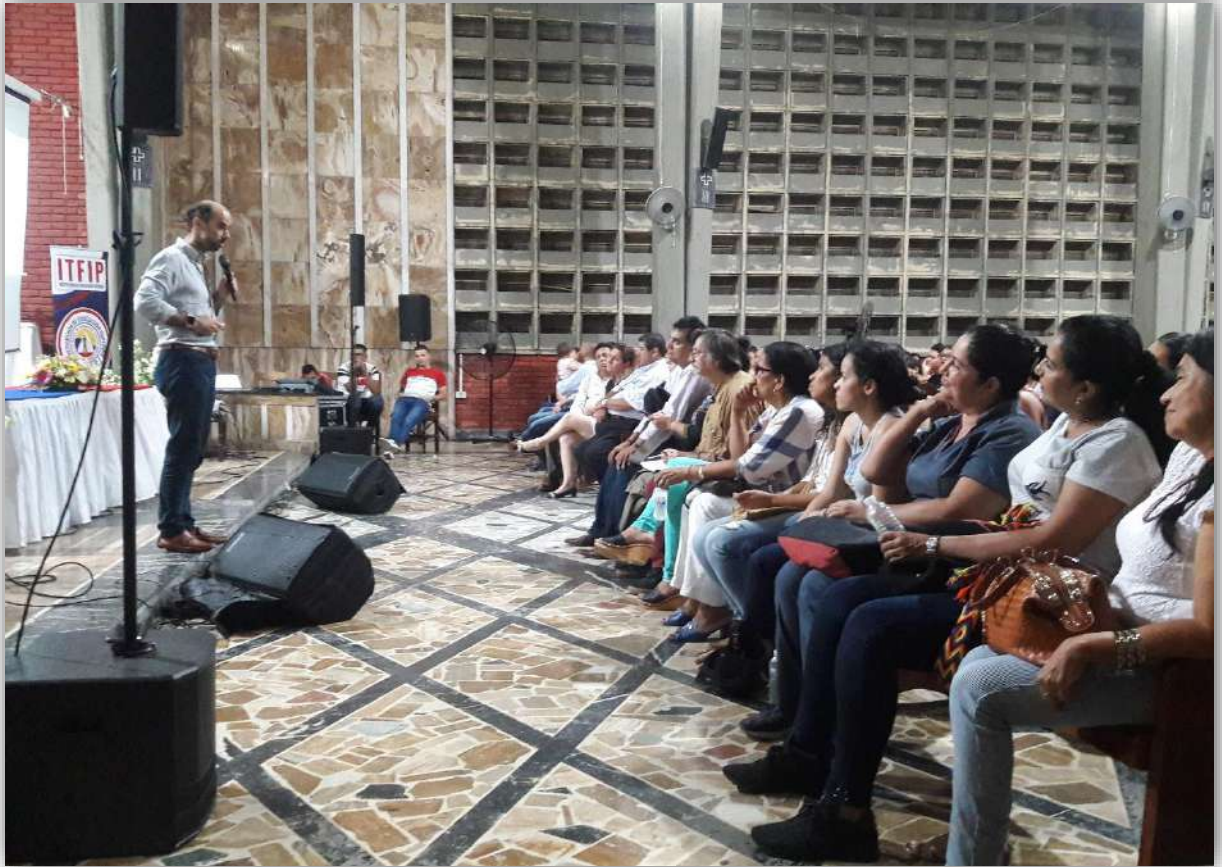
Imagen: Conferencia magistral