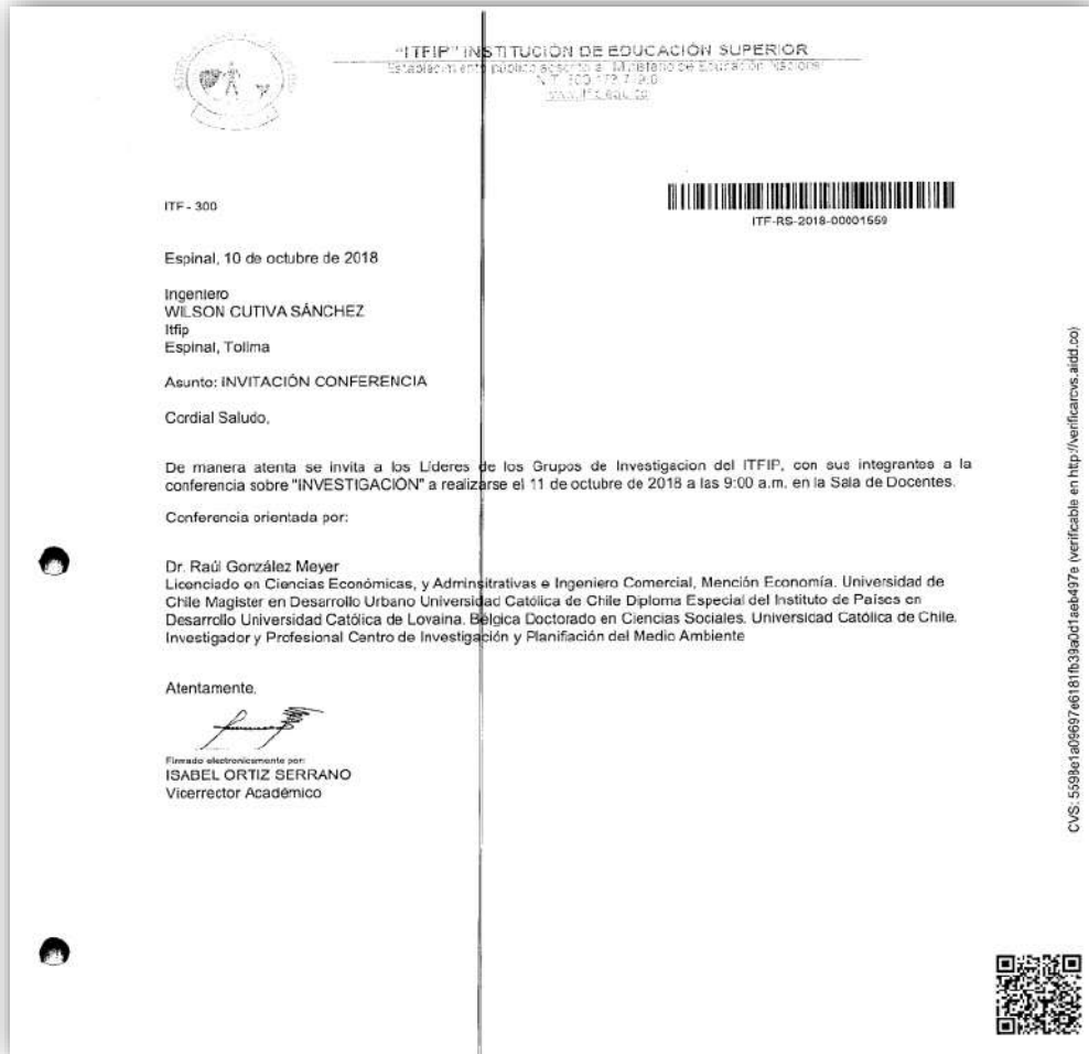
Imagen: invitación conversatorio