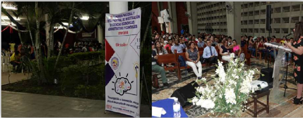
Imagen: Auditorio principal