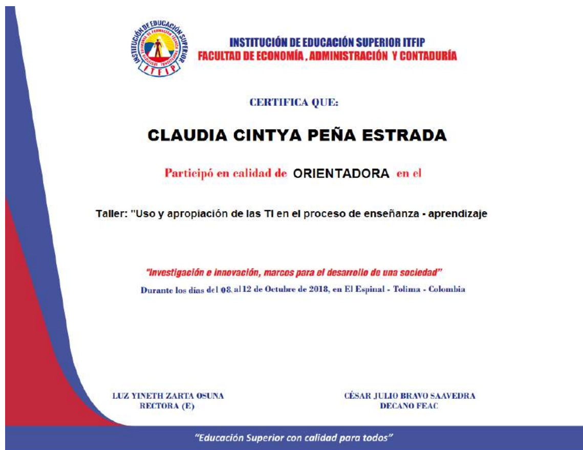
Imagen: Modelo certificado del taller