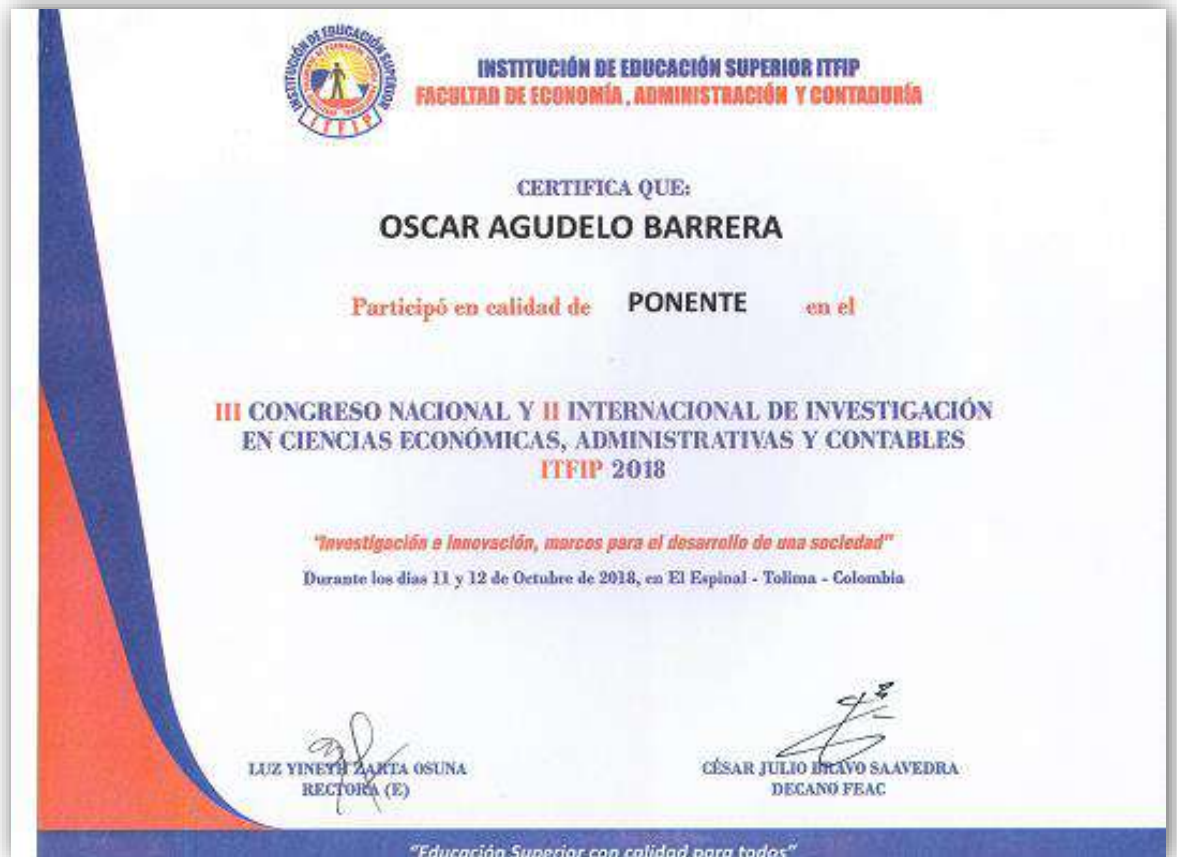
Imagen: Certificado Ponentes