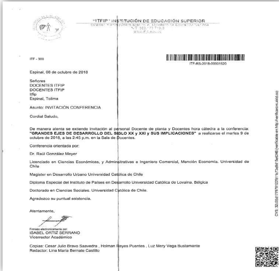
Imagen: invitación Conferencia