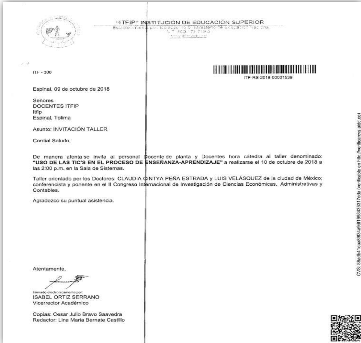
Imagen: invitación Conferencia