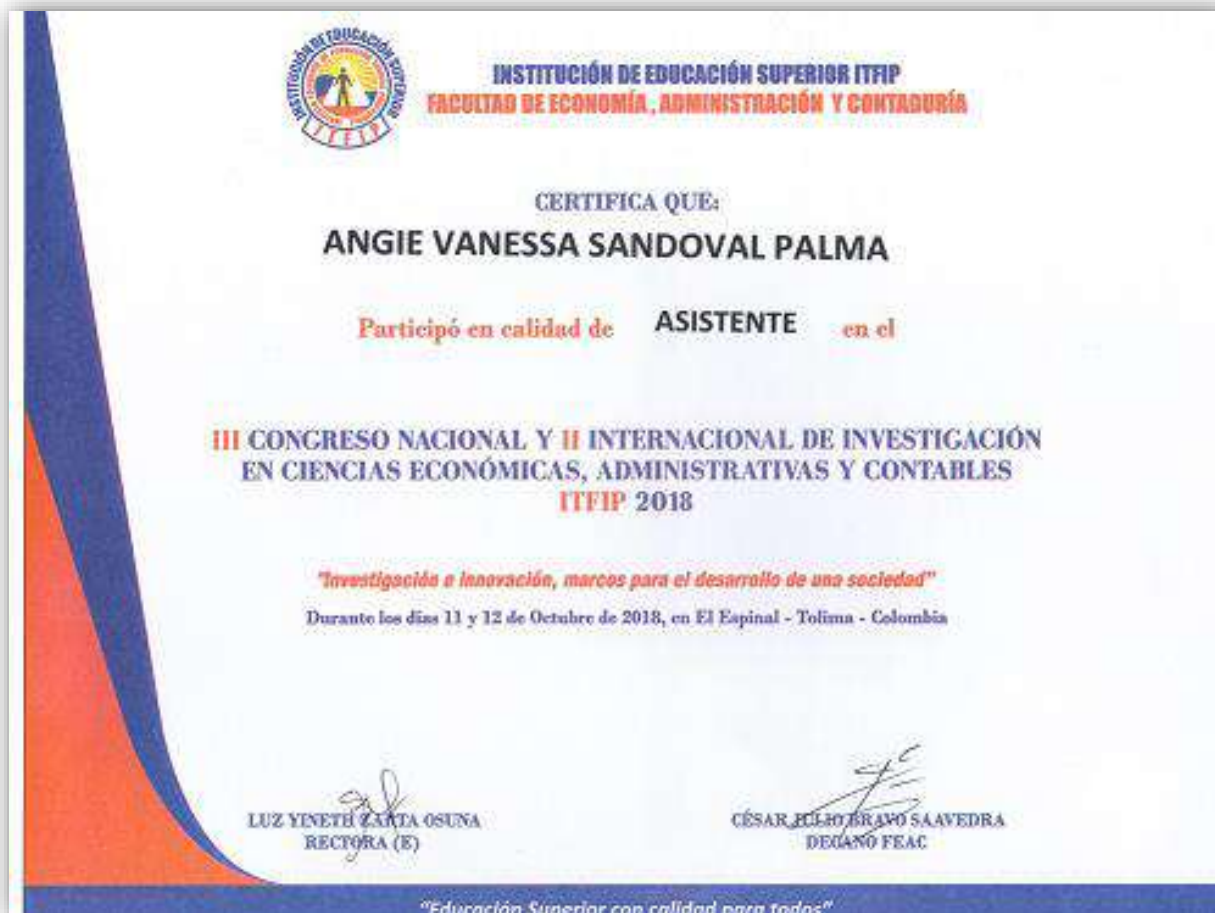
Imagen: Certificado Asistentes