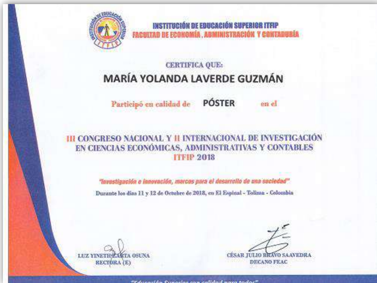
Imagen: Certificado Póster