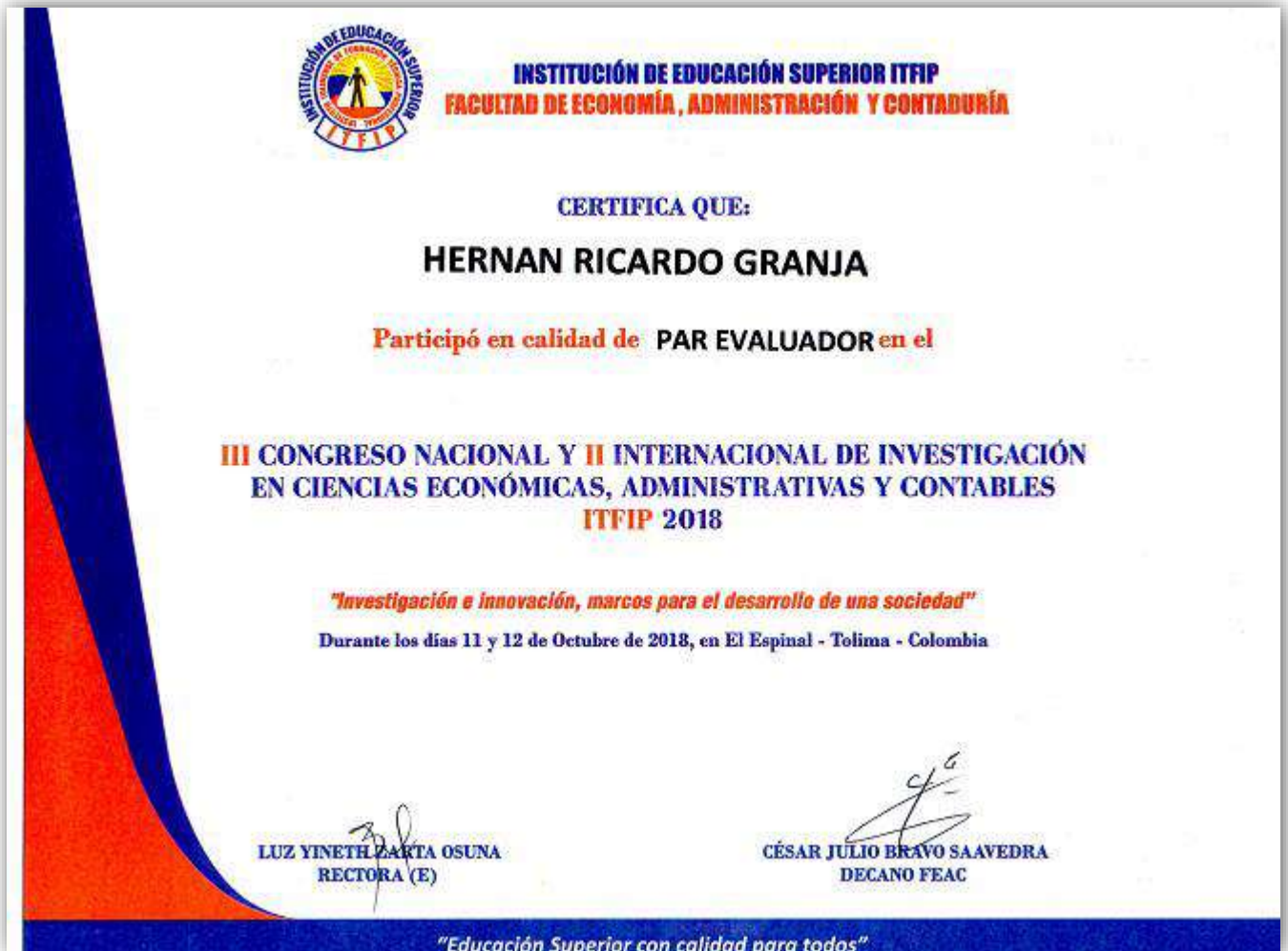
Imagen: Certificado Par Evaluador