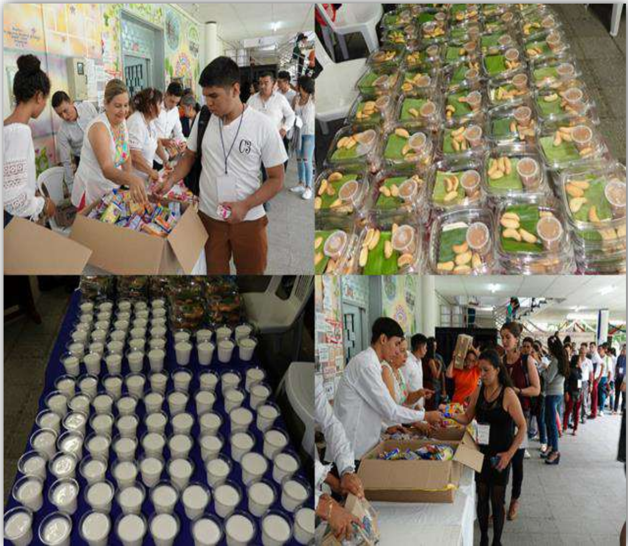
Imagen: Muestra Gastronómica