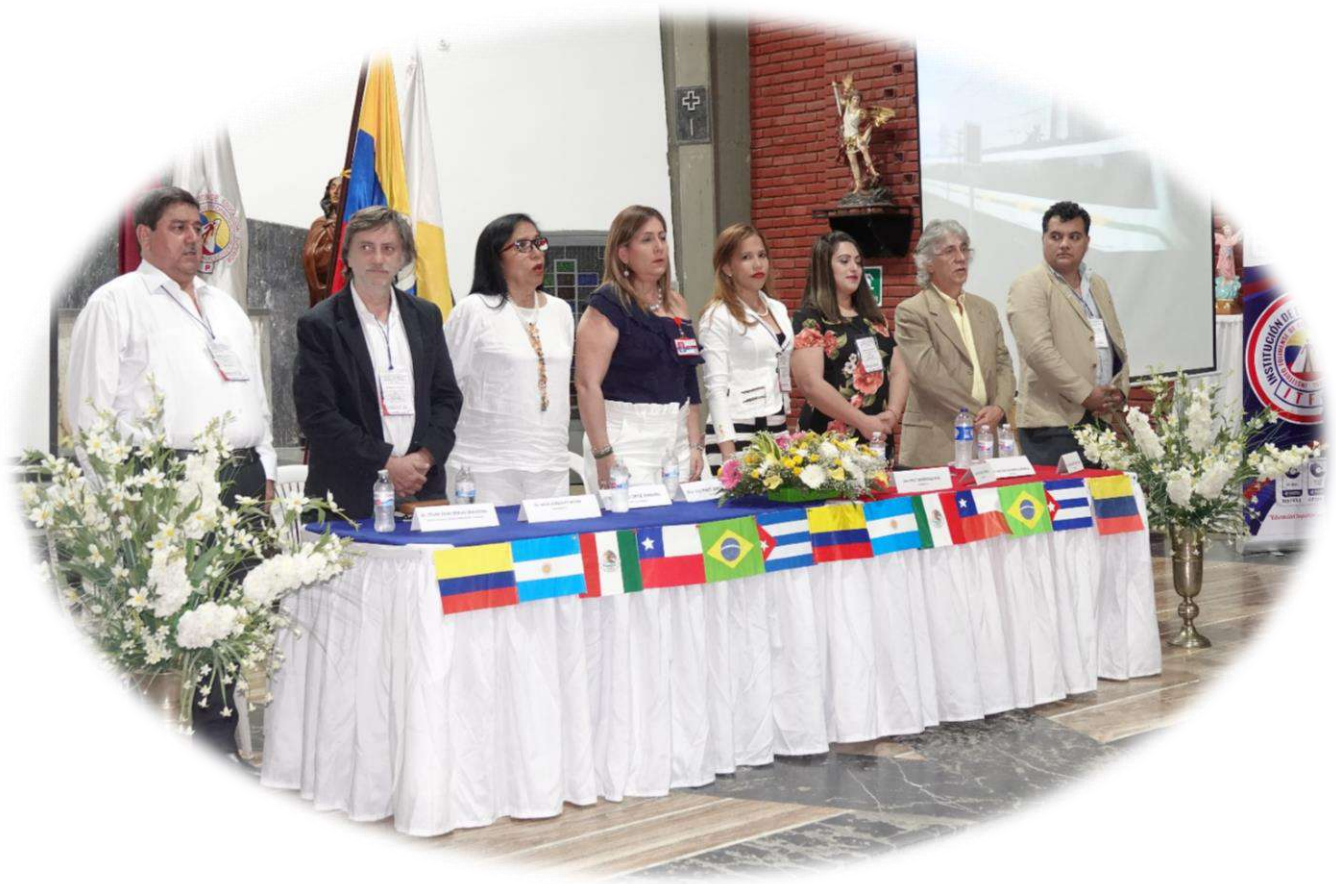
Imagen: Mesa principal del congreso