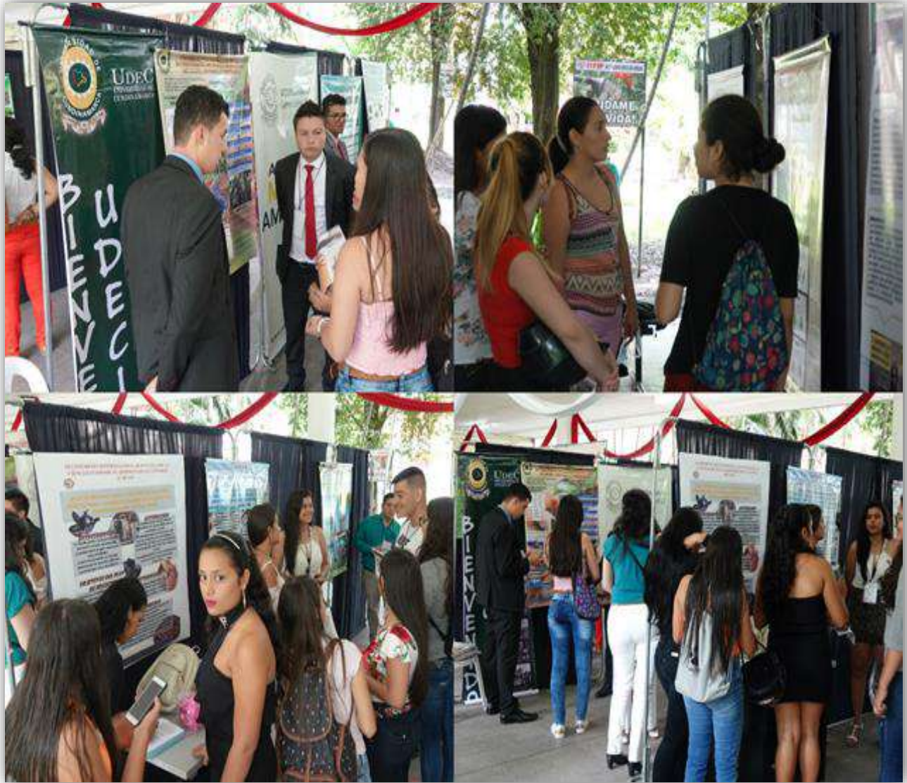
Imagen: Presentación de Póster