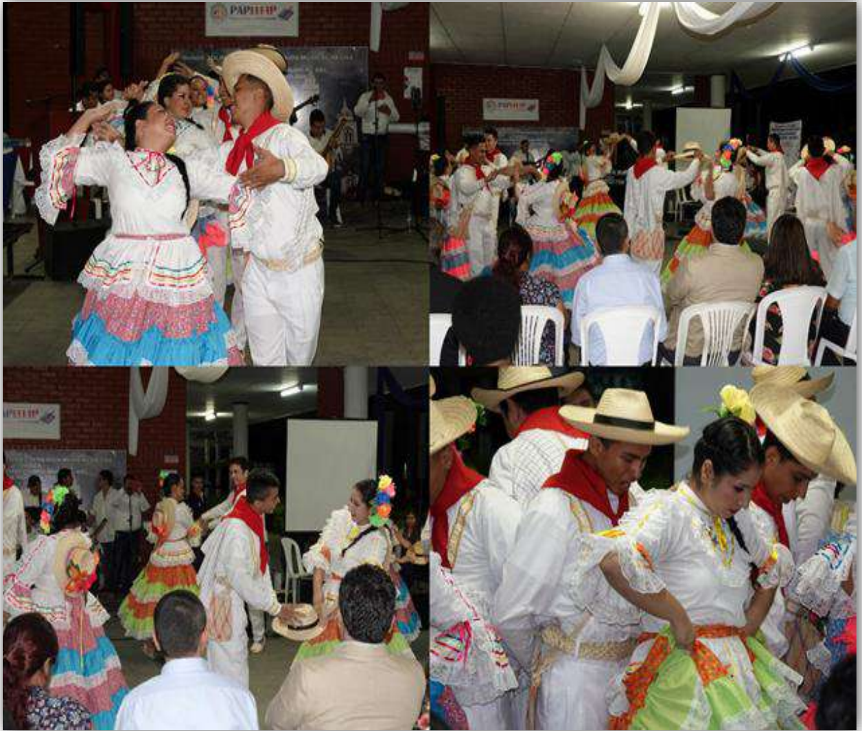
Imagen: Muestras Folclóricas